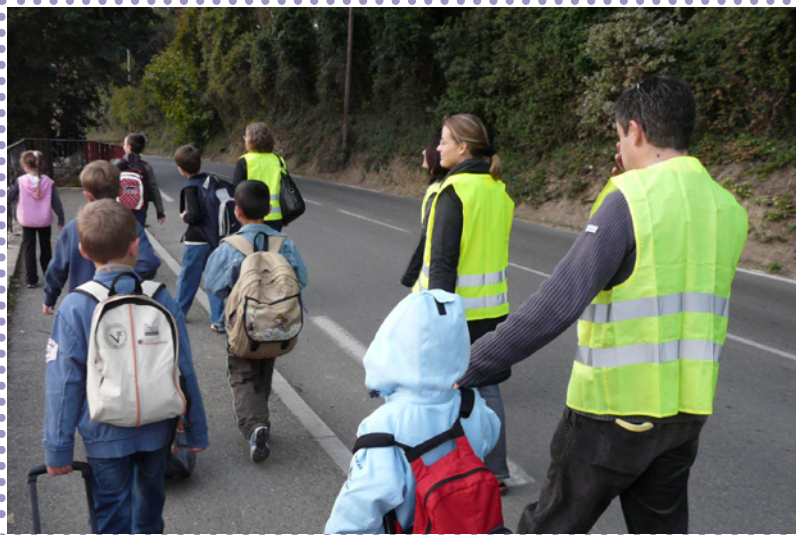
Le pédibus d'Auribeau-sur-Siagne

Enfin, la Région PACA a remis une « Palme Marchons vers l'école 2008 » à Pôle Azur Provence, le 26 novembre 2008 pour son action exemplaire auprès des communes.