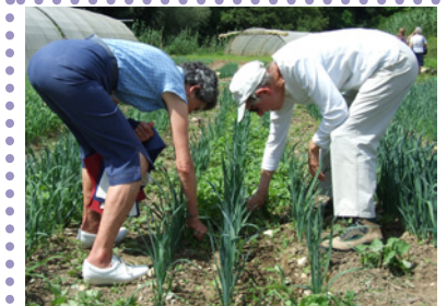
Découverte de l'agriculture Bio