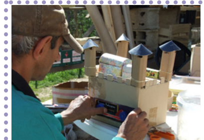
Atelier de création avec matériaux de récupération