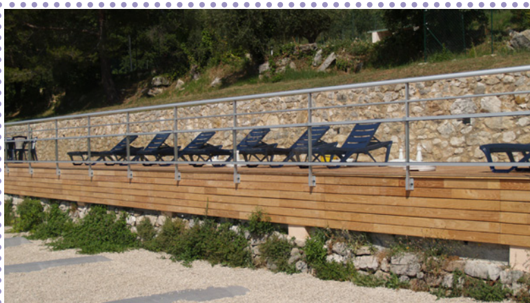
Rénovation du solarium de la piscine intercommunale Altitude 500

Cette année, des clauses environnementales ont été intégrées dans les marchés suivants : papier, reprographie, réhabilitation des piscines de Grasse, rénovation du solarium d'Altitude 500, traiteur, prestation de nettoyage, quincaillerie.