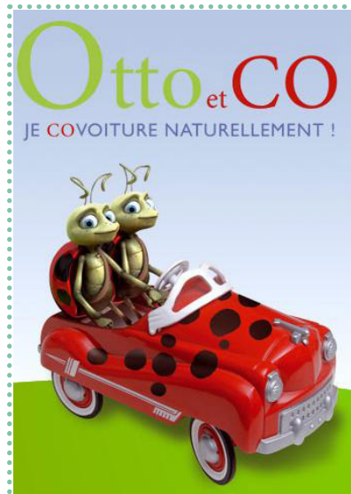
Action sur le covoiturage