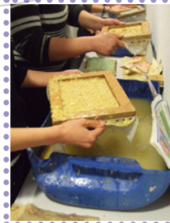
Recycler le papier au Lycée

En 2009, le jury a sélectionné 8 nouveaux lauréats : Maison pour Tous de Pégomas (Théâtrement Vôtre); Agora Fm (Mag'Jeunes à la radio); Ecole Gambetta (Sentier botanique des enfants); Arboretum du Sarroudié (A vos graines, citoyens !); Les Francas (Vie citoyenne au collège et lycée); Collège Les Jasmins (Journées Développement Durable au collège); Planète Sciences Méditerranée (Jardins partagés); Méditerranée 2000 (Les Agendas 21 scolaires).